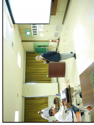
医療講演会の開催