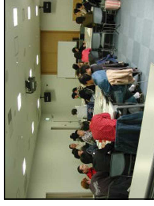
ライブセミナー等イベント開催